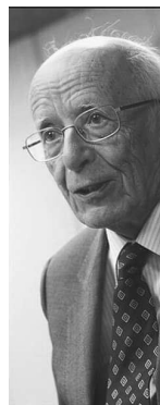
Emilio Lledó. Filósofo.

«A mí siempre me llama la atención que siempre se habla, y con razón, de libertad de expresión. Es obvio que se tiene que tener esto, pero lo que se tiene que tener, principal y primariamente, es libertad de pensamiento. ¿Qué me importa la libertad de expresión si no digo más que imbecilidades? ¿Para qué sirve si no sabes pensar, si no tienes espíritu crítico, si no sabes ser libre intelectualmente?».